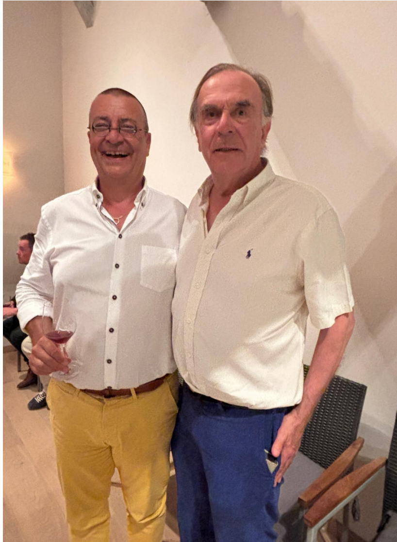
Twee gelukkige initiatiefnemers van een ongeëvenaarde degustatieve oefening

verzoenen. Geen enkele wijn is echt door de mand gevallen en zeker 10 wijnen van de 16 behoorde echt tot wereldniveau. Dit was te zien op het einde van de avond, want nog nooit waren de flessen zo leeg als tijdens deze EWOP-oefening. De reacties achteraf waren navenant.